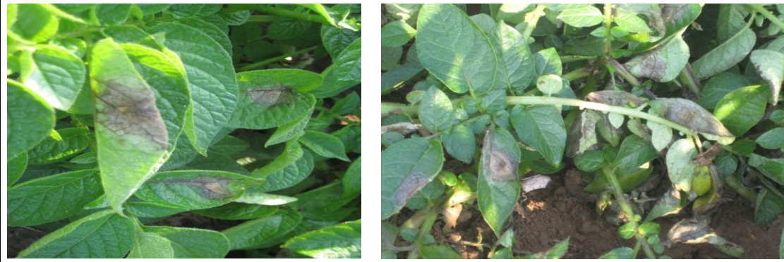
चित्र १ आलुको पछौटे डढुवा लागेको लक्षण

आलुबालीमा पछौटे डढुवा रोग व्यवस्थापनका लागि देहायका विधि अपनाउनुहोस्।