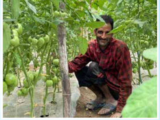
थोपा सिँचाइ र प्लाष्टिक मल्लिचड सहितको तरकारी खेती, माछापुच्छ्रे गा.पा., कोलेली