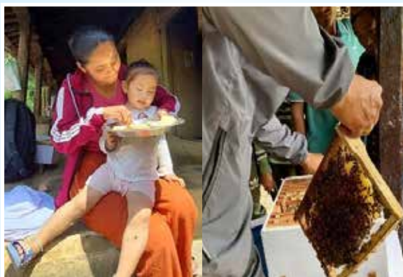
गोला सहितको मौरी घर वितरण, माछापुच्छ्रे गा.पा.