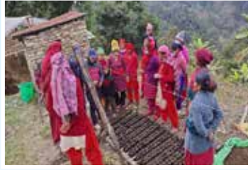
सेवा टेवा सहित स्थलगत तालिम, मादी गाउँपालिका