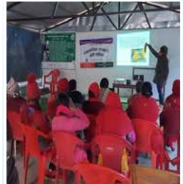
सेवा टेवा सहित स्थलगत तालिम पोखरा म.न.पा., अन्नपूर्ण गाउँपालिका