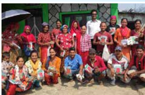
घरायसी बगैँचाको लागि कम्पोजिट बीउ वितरण, रुपा गा.पा.