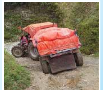
नामार्जुन अलैंची ब्लक विकास कार्यक्रम, मादी गा.पा.