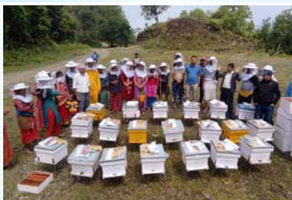
गोला सहितको मौरी घर वितरण, मादी गा.पा.