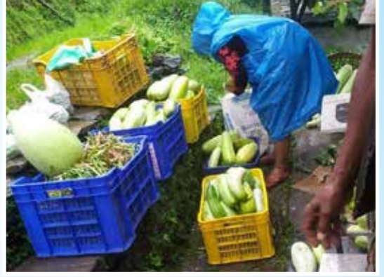
अन्नपूर्ण गाउँपालिका-३, रयाले