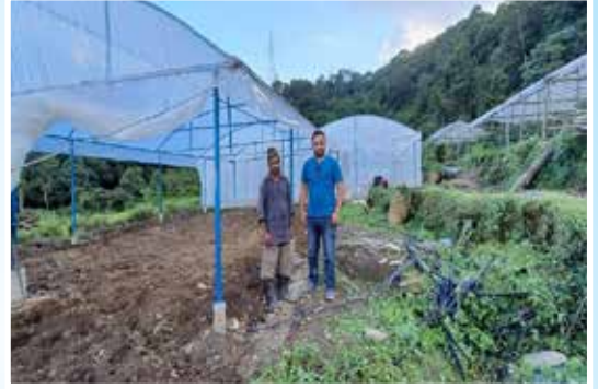
तरकारी ब्लक विकास कार्यक्रम, माछापुच्छ्रे गा.पा.