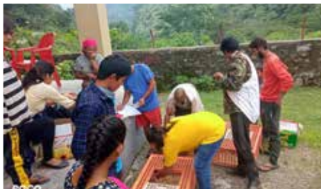
अण्डा मासुका लागि कुखुरा चल्ला वितरण, माछापुच्छ्रे गा.पा.