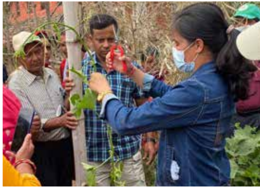
लहरे बालीमा ३ जी कटिङ्ग प्रदर्शन पोखरा म.न.पा.-२६