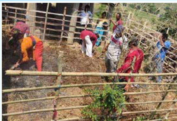
घरायसी कुखुरा पालनका लागि खोर निर्माण, रुपा गा.पा.