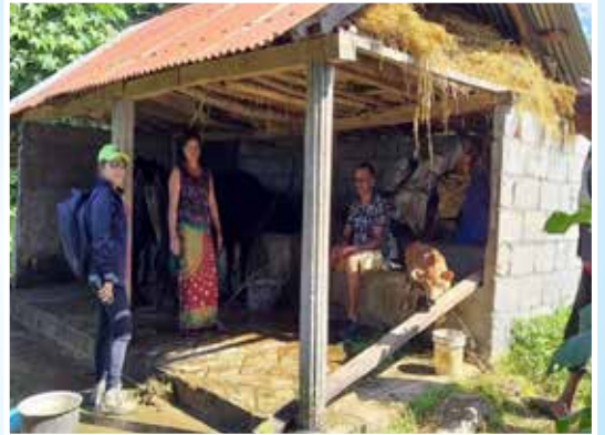
माछापुच्छ्रे गाउँपालिका-३, घाचोक