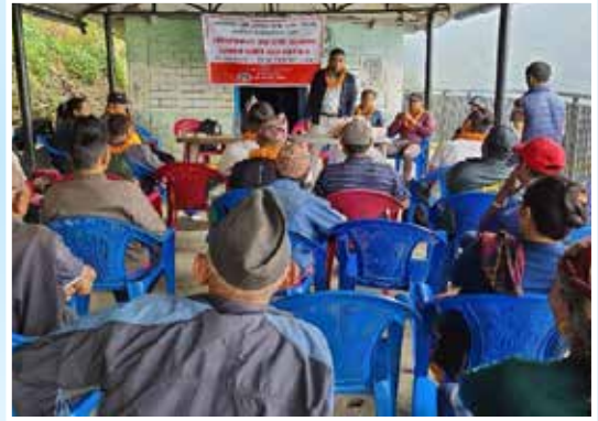
ब्लक विकास कार्यक्रम अभिमुखीकरण, मादी गा.पा.