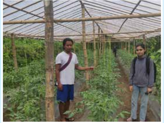
भकारो सुधार तथा प्लाष्टिक घरमा तरकारी खेती, मादी गा.पा.-ट