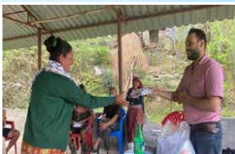
कृषक अभिमुखिकरण तथा बीउ वितरण, पोखरा म.न.पा