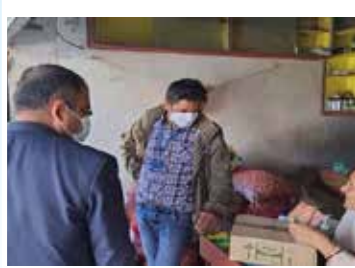
एग्रोभेट अनुगमन पो.म.न.पा.